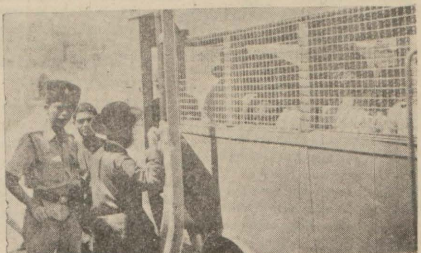
Yahudi mevkufla: tel örgülü kamyonlarla naklediliyor.

Bir Yahudi Tedhiş Çetesinin İşlettiği Bu Radyo Bir Türü Bulunamıyor